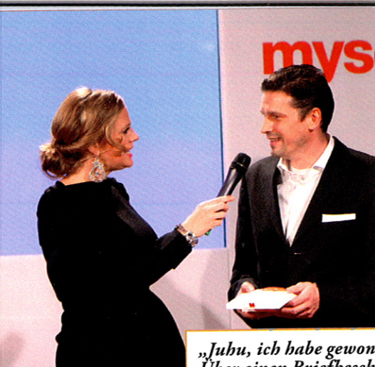
„Juhu, ich habe gewonnen!“ Über einen Briefbeschwerer hat man sich selten so gefreut.