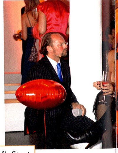
Es muss nicht immer die Sport- schau sein, die Männer in den Bann zieht, es kann auch mal ein Frauenmagazin sein.